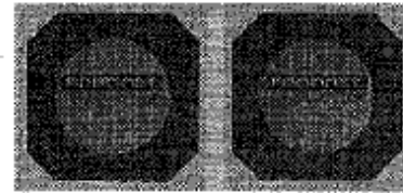
FortiASIC NP2 / CP6

中規模ネットワークにおける内部ネットワークセキュリティセグメントの展開に必要なパフォーマンスと柔軟性を提供する。